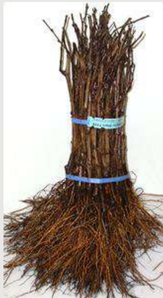
Scheme de certificare