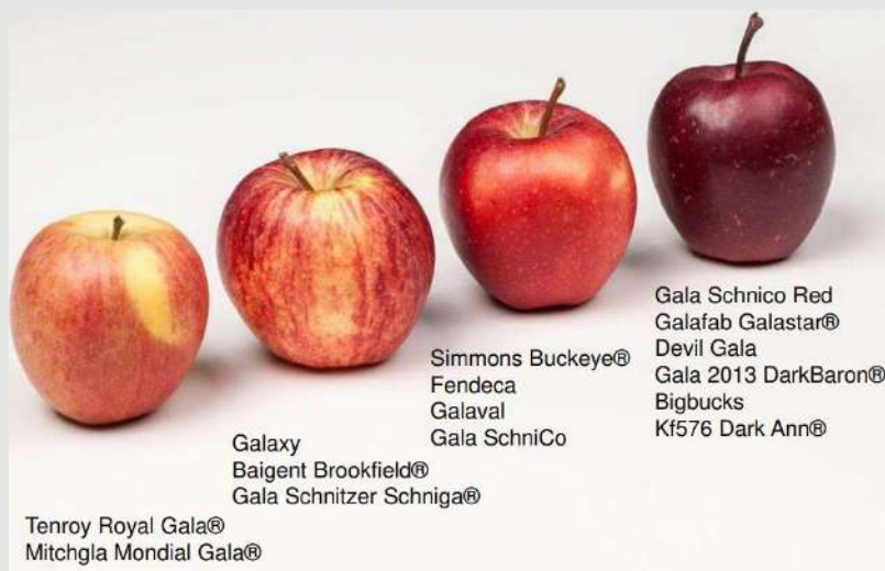
Evoluția clonelor soiului GALA