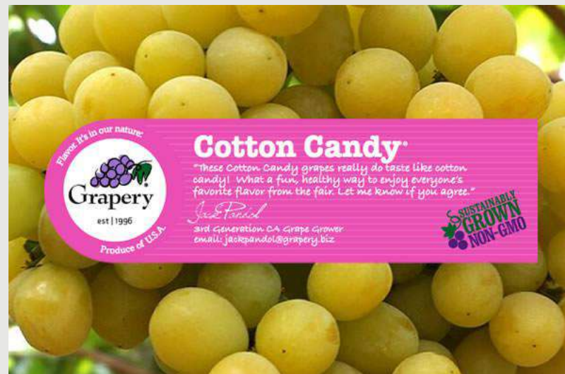
Struguri apireni cu gustul vatei de zahăr